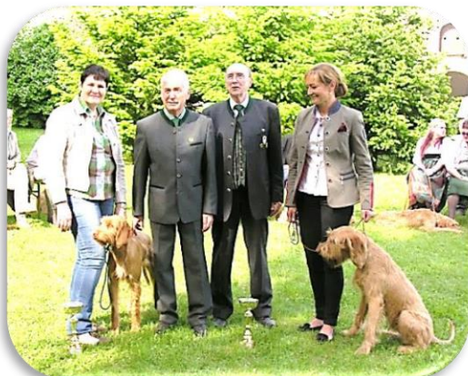
Hanni vom Steinberg V1, JB, BOB