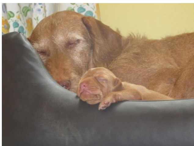
Gold-Chilli vom Steinberg, Hündin, ÖHZBNR. MVD 408,